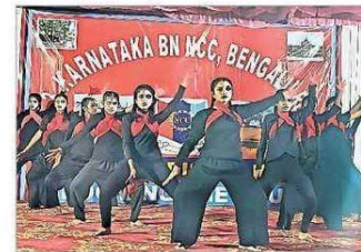
ಪಿಎಸ್‌ಸಿ 20 ಸ್ಪರ್ಧೆಗೆ ವೈಯಕ್ತಿಕ ಯಶಸ್ಸು