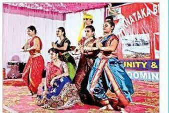
ಸಂಭ್ರಮದ ಸ್ವಾಗತ ವಿದ್ಯಾರ್ಥಿಗಳು